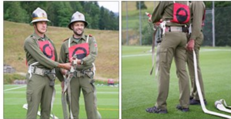
Abb. 57: Endaufstellung ATR (1,2) (MMst. Harry Simeoni)

vor dem gekuppelten C-Kupplungspaar und vor beiden C-Schläuchen (Schlauchreserve) stehend. Blick in Angriffsrichtung, ausgerüstet mit zwei Schlauchträgern.