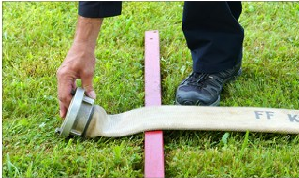
Abb. 44: Richtiges Ablegen der Kupplung des zweiten B-Schlauches

Wird die Zubringleitung nicht über die „41-Meter-Markierung“ hinaus ausgezogen, der Metallteil der Kupplung des B-Schlauches muss (in Angriffsrichtung gesehen) zur Gänze jenseits der „41-Meter-Markierung“ abgelegt werden , wird „Schlecht ausgelegte Druckschläuche“ bewertet.